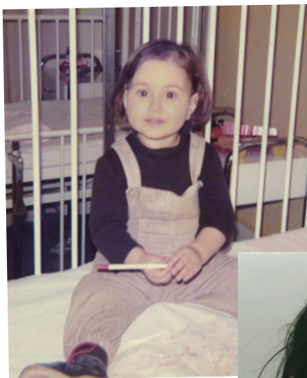
Bedia als Kind...

Inzwischen kann ich mich vielseitiger ernähren und esse täglich 1000 – 1500 mg Leucin öfters per Augenmaß. Dafür habe ich mir gedanklich ein Ampelsystem, die „MSUD-Ampel“, überlegt.